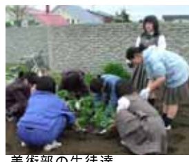
美術部の生徒達 綺麗な花が咲いたら、スケッチするよ...

六月八日(木)にPTA事業委員会の皆さんに校門両側の花壇に花の苗を植えていただきました。事前に機械で花壇を耕し、さらに肥料を入れて整地と大変手間をかけていただきました。今年の移植に美術部の生徒も参加してくれました。最近の晴天できれいな花がたくさん咲いてきています。