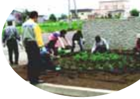
花壇に線を引いて、苗を一株ずつ丁寧に植えていきました