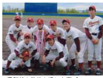
優勝旗と賞状を手に大喜び!!! 野球部3年生

六月十一日、市営球場で行われ、風連中に五対二、決勝戦で土別中を延長八回三対二で破り優勝しました。この大会の優勝をばねに中体連も全力で戦い、上川代表決定戦への権利を勝ち取って、期待を待っています。